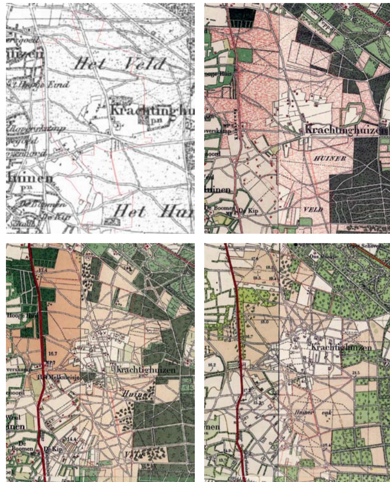
Historische ontwikkeling 1850, 1900, 1930, 1950