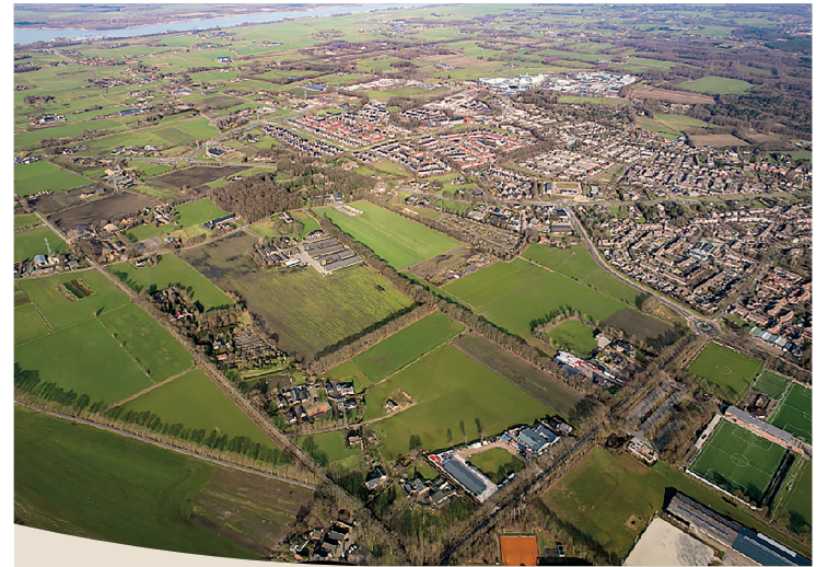
Locatie toekomstige woonwijk