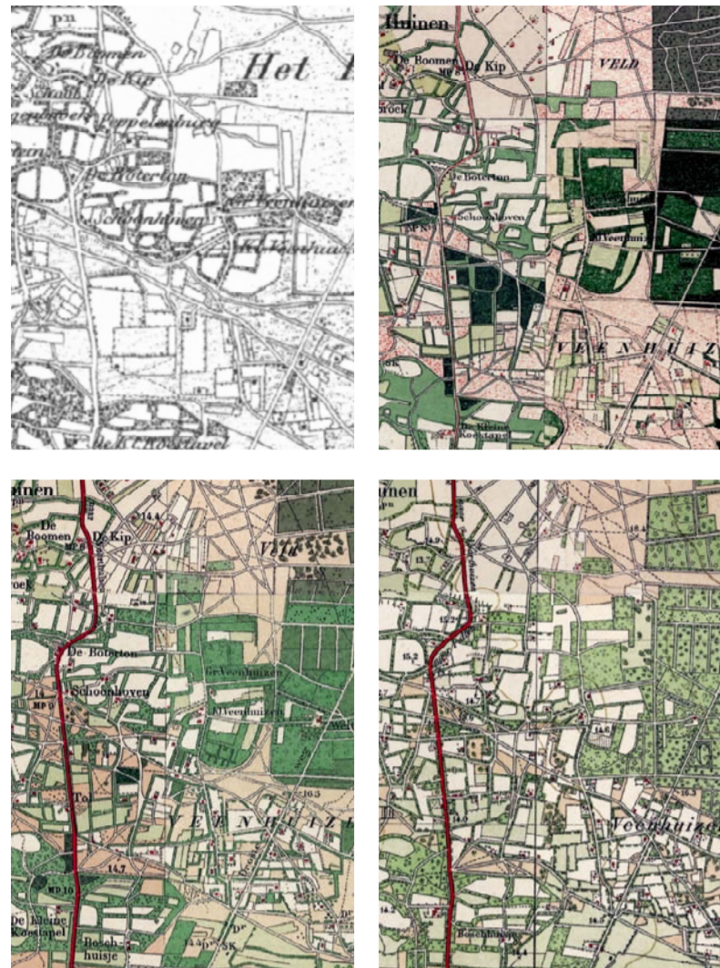
Historische ontwikkeling 1850, 1900, 1930, 1950