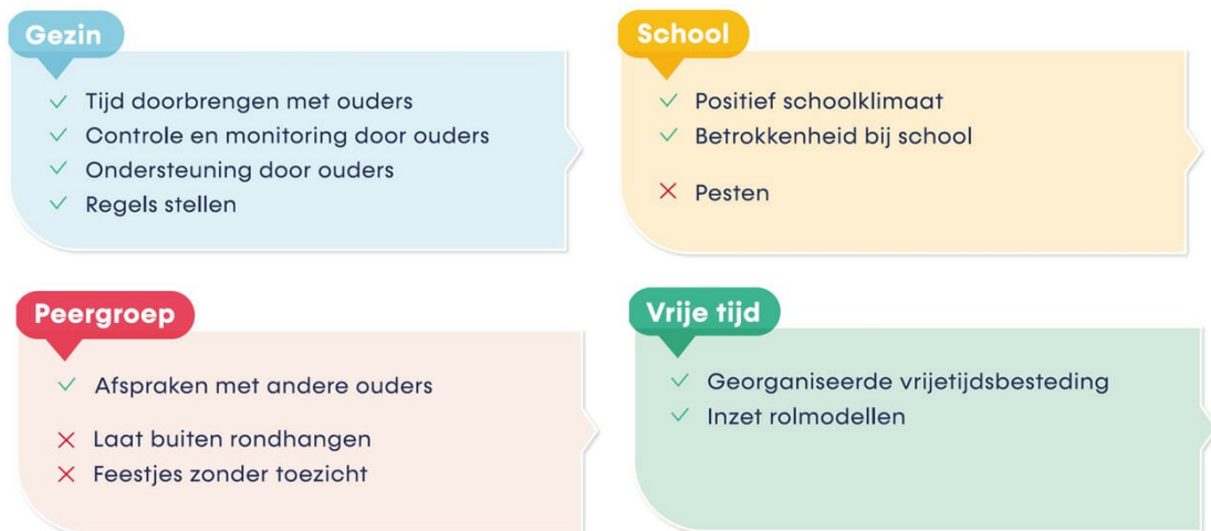
Figuur 2: Beschermende en risicofactoren in de vier omgevingen

Opgroeien in een Kansrijke Omgeving (OKO) is een Nederlandse aanpak, gebaseerd op het IJslandse preventiemodel. Met de OKO-aanpak werkt iedereen in een gemeente (lokaal) aan het vormen van een positieve leefomgeving voor jongeren. OKO richt zich op jongeren van 12 tot 18 jaar. In Figuur 2 staan de vier omgevingen met de wetenschappelijk onderbouwde beschermende en risicofactoren.